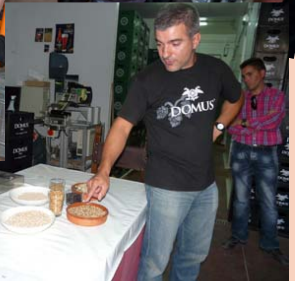
Visita fábrica de cerveza artesana DOMUS